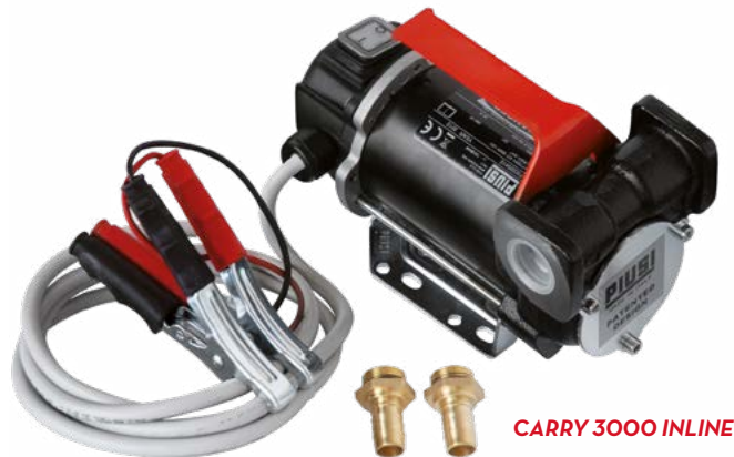
CARRY 3000 INLINE