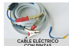
CABLE ELÉCTRICO CON PINZAS