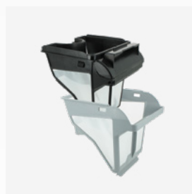
Caixa filtrante Filtro de nível duplo : 150/60 µ