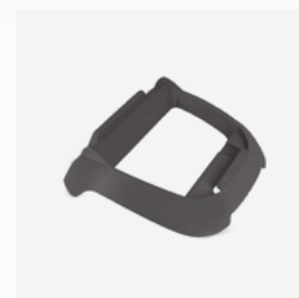
Base para caixa de controlo