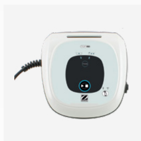
Caixa de comando