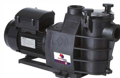
Bomba Superpool 3/4CV e 1CV