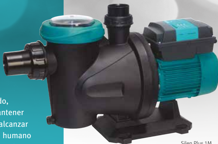
Silen Plus 1M

evopool® significa progreso, y como tal, a partir de ahora englobará todas las mejoras e innovaciones que ESPA vaya desarrollando e introduciendo en sus productos y aplicaciones a las piscinas. Siempre garantizando la máxima eficiencia y un tratamiento sostenible de los recursos energéticos. Hoy y en el futuro, ESPA es evopool® .