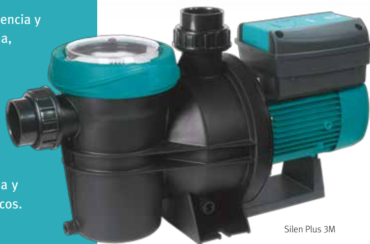
Silen Plus 3M