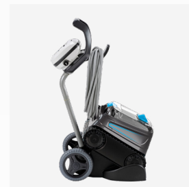
Carro de transporte