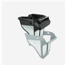
Caixa filtrante Filtro de nível duplo : 150/60 µ