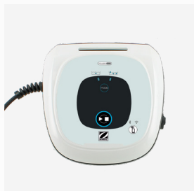
Caixa de comando