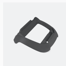
Base para caixa de controlo